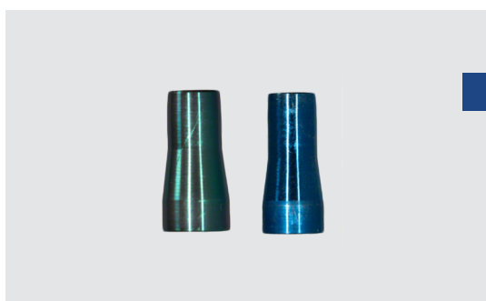
Стоппер для прямого аппликатора для контроля степени захвата пина