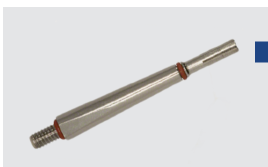
Сменная насадка для прямого аппликатора