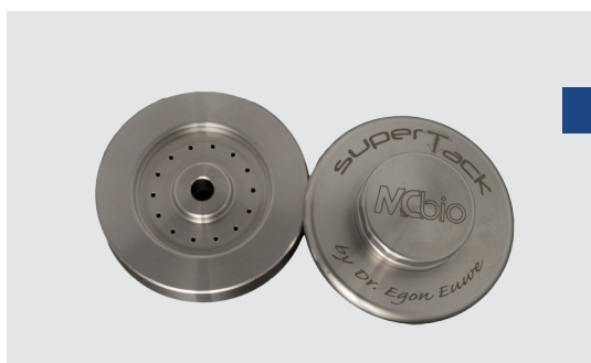
Контейнер для пинов для хранения и установки любых пинов Osteosynt