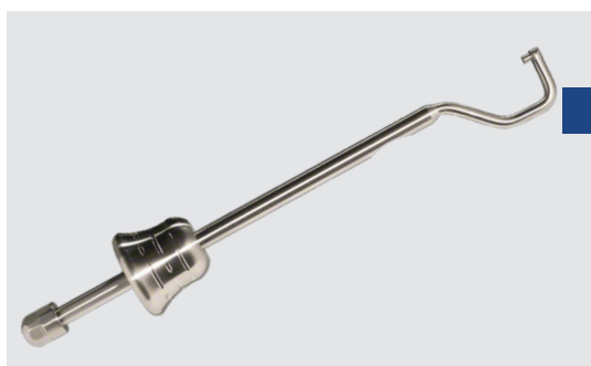
Аппликатор лингвальный для установки любых пинов Osteosynt