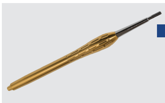
Аппликатор прямой для установки любых пинов Osteosynt