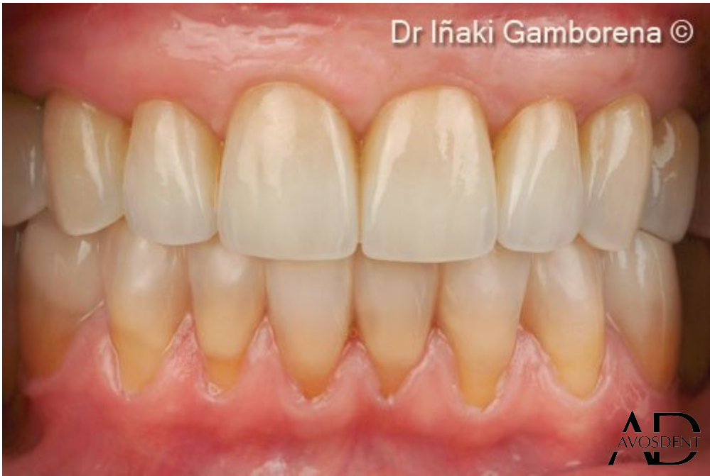
12. После проведенного лечения.