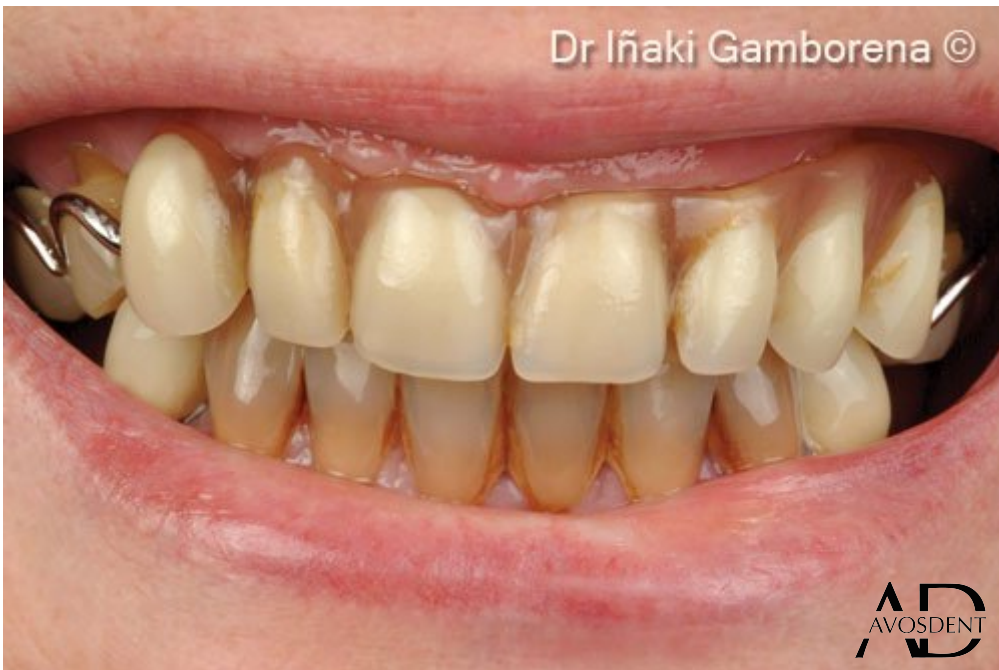
13. Улыбка до имплантации.