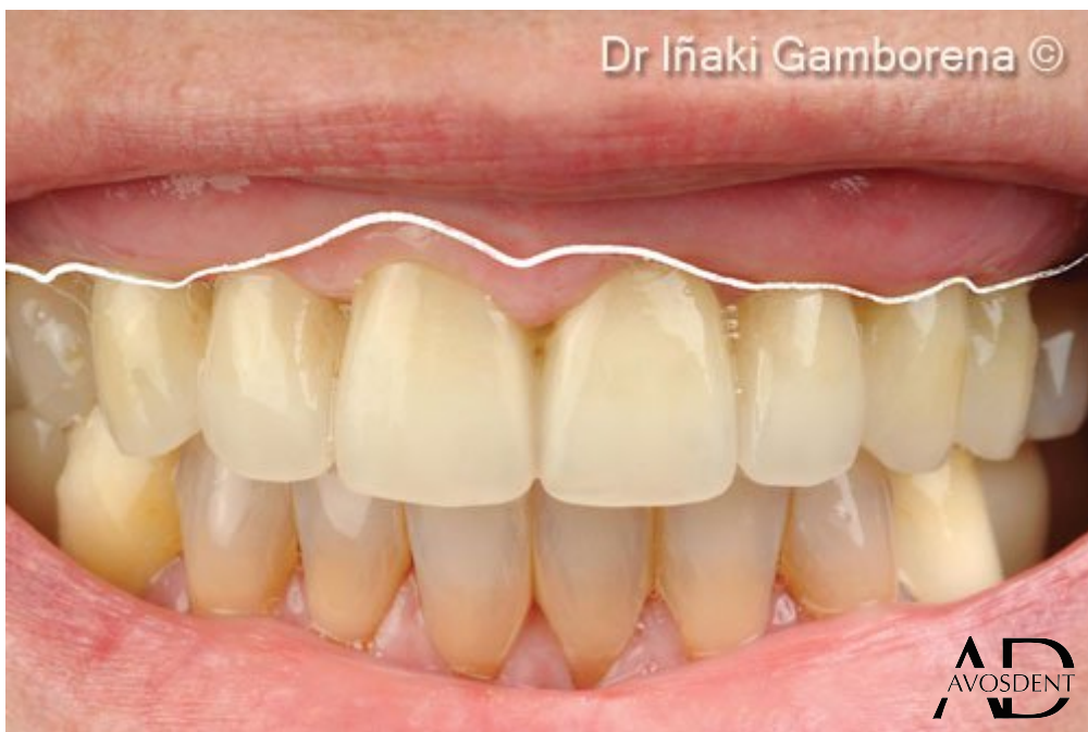
8. Временное реставрационное соединение. Обратите внимание на отсутствие ороговевшей слизистой оболочки и режущий край слизисто-десневой границы на линии улыбки со стороны верхней губы.