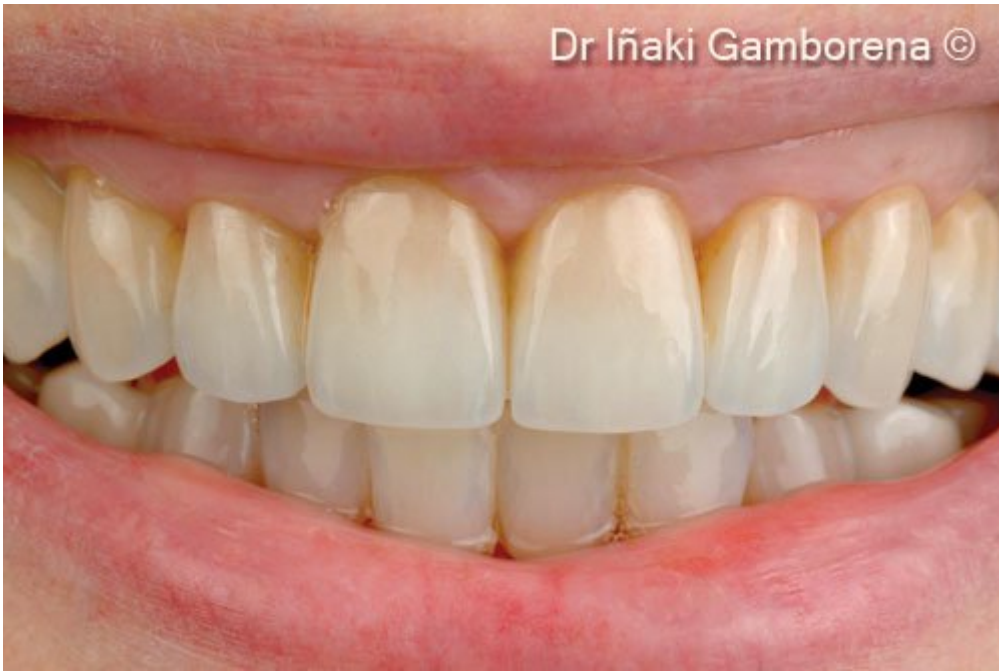
14. Улыбка после имплантации.