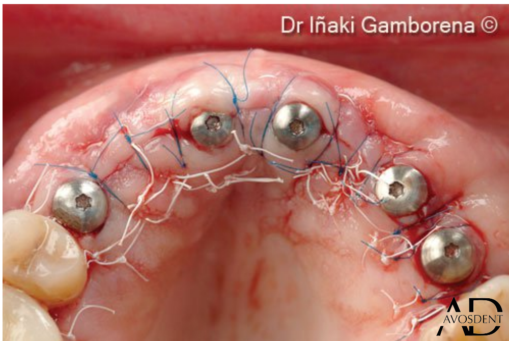
7. Соединительнотканый трансплантат гребневого бугра + соединение мультиюнитов и соответствующих формирователей десны.