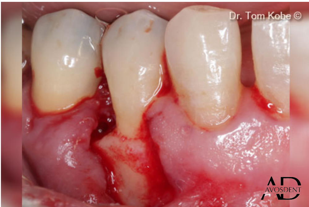
4. Открытие доступа к дефекту.