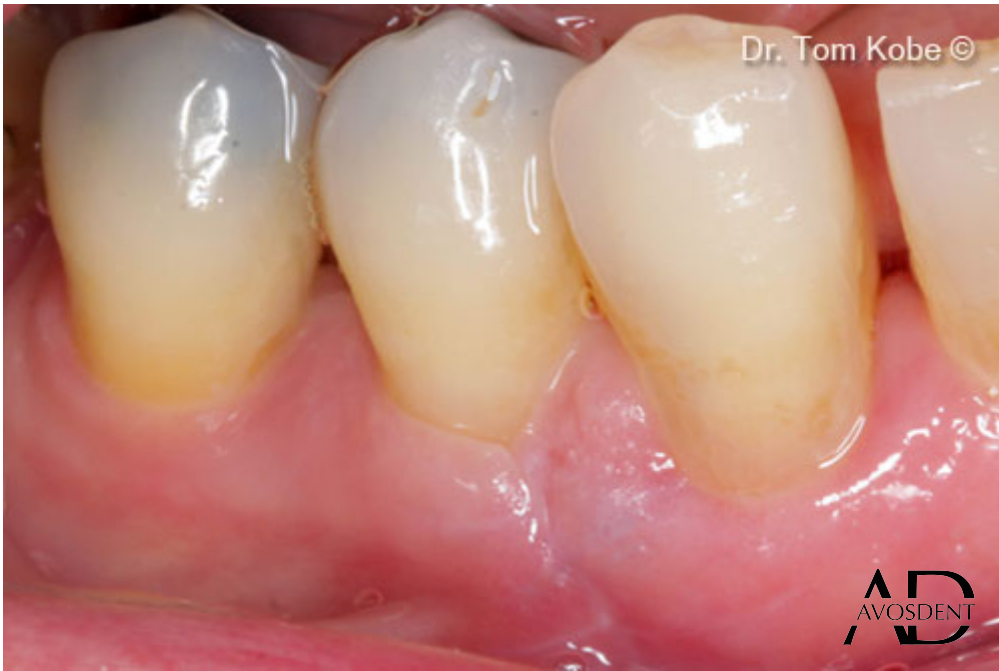
9. Ситуация через 2 недели после операции.