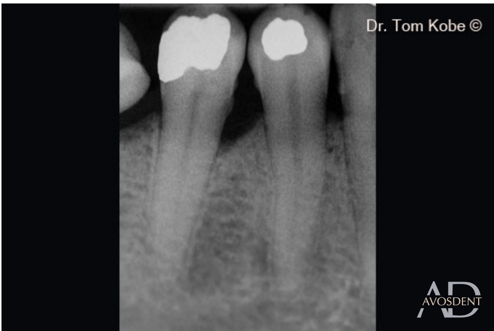
2. Вертикальный дефект кости на рентгенограмме.