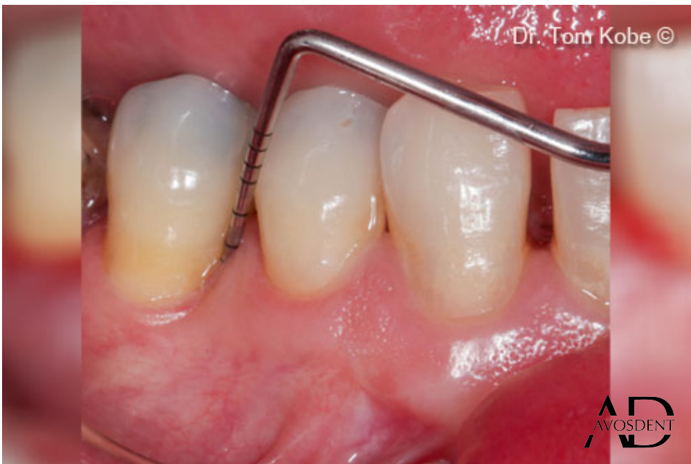
12. Ситуация через 1 год наблюдения.