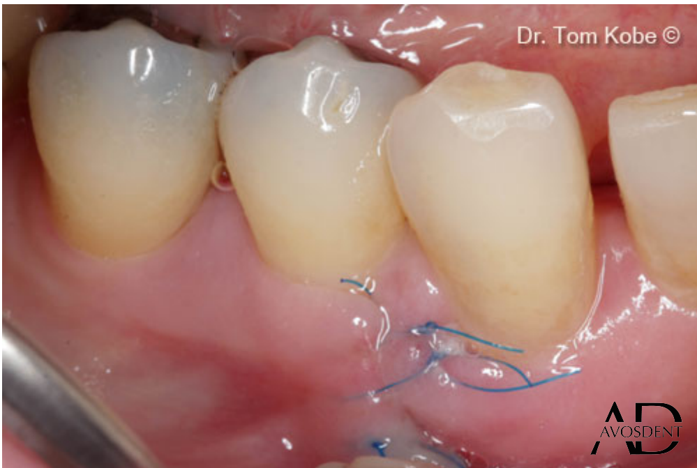
8. Полное заращание раны через неделю.