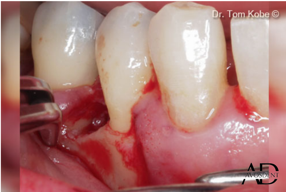
5. Удаление зубного камня и обработка корней.