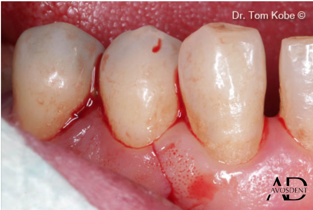
3. Горизонтальный разрез соседнего зуба.