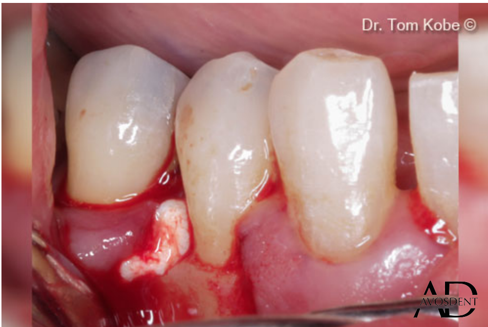
6. Заполнение дефекта костным гелем OsteoBiol® Gel 40.