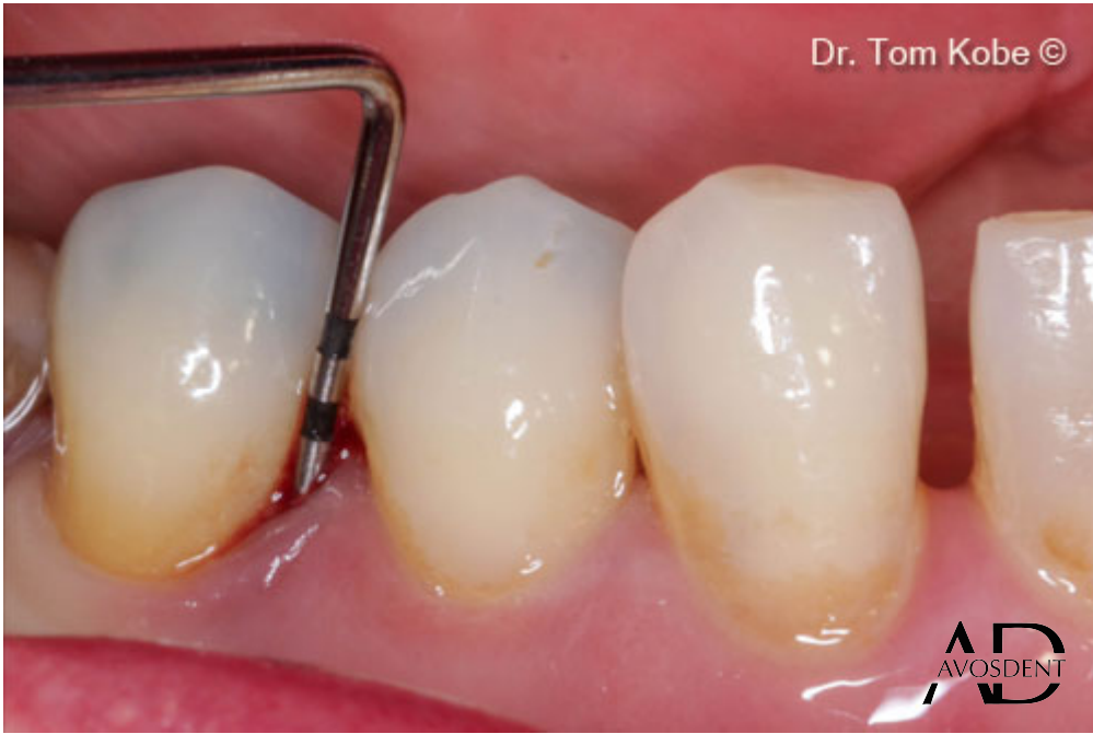
1. Исходная ситуация.